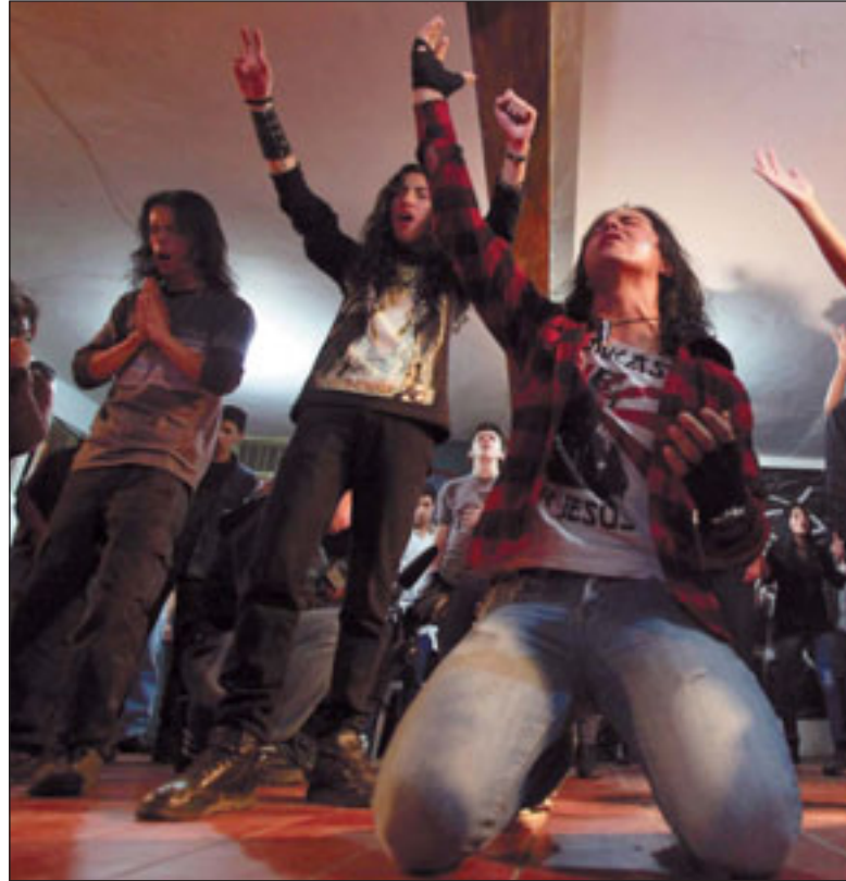
"Pantokrator" es una iglesia cristiana evangélica y sus seguidores aseguran que son creyentes con un gusto musical especial.

Las ceremonias de la iglesia que está ubicado en la capital colombiana se realizan al sonido estridente del rock pesado de guitarras, bajo y batería que tienen como objetivo principal adorar a Dios y no hace música.