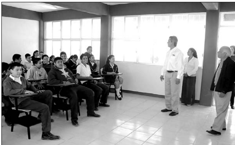
Estudiantes y maestros de la Secundaria 8, recibieron dos nuevas aulas de parte del Gobierno Municipal.

para elevar la calidad educativa y aumentar la capacidad de atención de alumnos con la necesidad de estudiar", mencionó Ortiz.